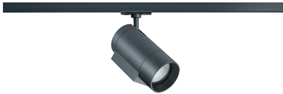
ARCOS 2 xpert LED | 22 W