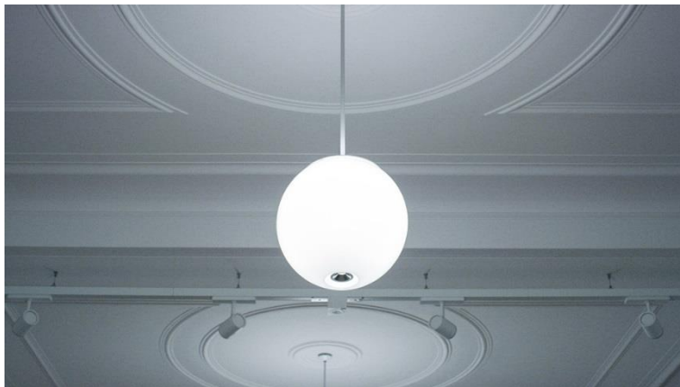
Bild 2: Räumen eine Maßstäblichkeit geben – das kann ALVA. Sie kann, passend zur Situation, unauffällig zurücktreten oder sich als Objekt präsentieren.

Bild 1: TEELA ist so vielseitig wie der Mensch. Ihre zusätzliche Eigenschaft aber, Räumen eine Aura zu verleihen, macht sie nahezu übermenschlich.