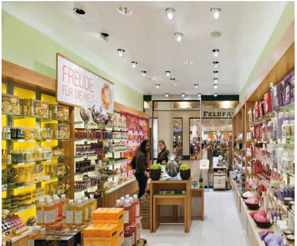
B3 | Das LED-Downlight Panos Infinity und der LED-Strahler Discus zählen zu den modernsten LED-Leuchten im Zumtobel Produktportfolio. Ihre Lichtqualität und Effizienz setzen Maßstäbe.